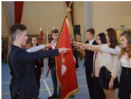
Poczet sztandarowy podczas ceremonii ślubowania klas pierwszych

poprzedzić zapowiedzią. Ponadto, opracowując scenariusz przebiegu uroczystości, należy uwzględnić możliwości psychofizyczne uczestników, zwłaszcza dzieci i młodzieży, tak aby momenty, kiedy uczestnicy stoją w pozycji zasadniczej, nie trwały zbyt długo.